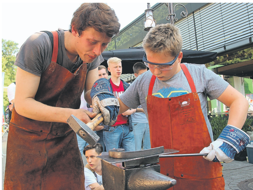
Selbst mal anpacken, dann macht's doppelt so viel Spaß. Beim Stand von Ro- bers Leuchten durften junge Bomah-Besucher zum Hammer greifen.